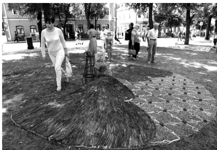
Piktagalio kaimo bendruomenė aktyviai dalyvauja įvairiose kūrybinėse veiklose – šiemet šios bendruomenės narių pintas floristinis kilimas buvo apdovanotas kaip kūrybiškiausia kompozicija.

Piktagalio kaimo bendruomenė vykdydama šį projektą organizavo